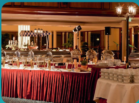
Donnerstagabend Festlicher Ausklang