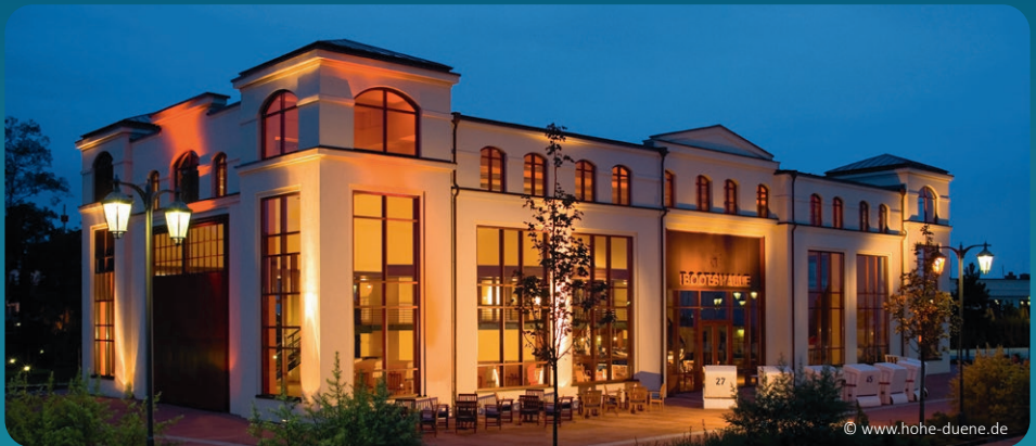
Mittwochabend: Musik und Tanz in der Bootshalle