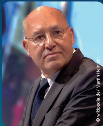
Montag Abendvortrag RA Dr. Gregor Gysi und gemütliches Beisammensein